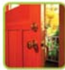
Alerta da porta e janelas