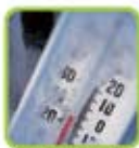
Alerta dos níveis de temperatura