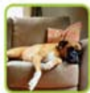
Monitore seus animais de estimação