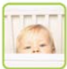
Monitore seus filhos

O homeview é um sistema multifuncional revolucionário. Ideal para monitoramento e controle dos ambientes. Pode ser personalizado de acordo com suas necessidades. De casa, do trabalho e até mesmo nas férias você pode ficar de olho no que realmente é importante e ser avisado das atividades monitoradas pelo seu sistema.